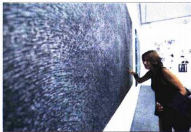
Suvremene umjetničke prakse u staroj tiskari

posebno brojna, bila je postavljena od vrsnih poznavatelja likovne umjetnosti koji djeluju u zemlji i inozemstvu i koji su sa zanimanjem razgledavali izložke što pripadaju raznim segmentima likovno-umjetničkog izražavanja.