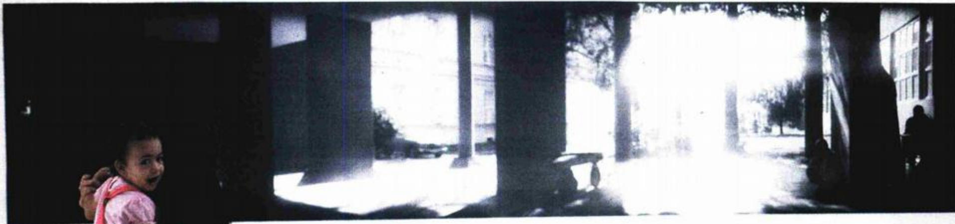
Izložba fotografija u Gradskoj galeriji Motika

Preksinoć otvorena fotografska izložba u pulskoj Gradskoj galeriji Motika na kojoj su se predstavili pulski, zagrebački i slovenski autori bila je uvertira velikoj međunarodnoj izložbi na kojoj sudjeluje više od 60 autora. Jučerašnje prijepodne proteklo je u znaku predstavljanja sve afirmiranije zagrebačke galerije Greta