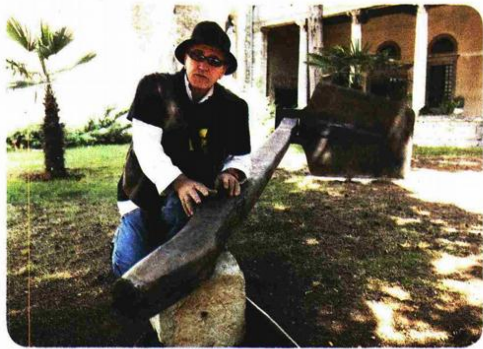
"Motika Velog Jože" Reflika Salijija Fika

grada i privukli pozornost Puljana i turista.