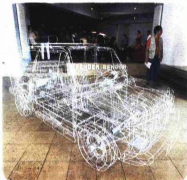
Detalj s izložbe "Dimenzije humora"