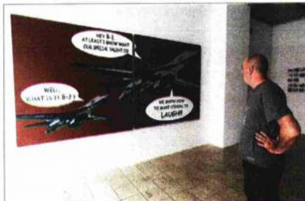
S izložbe "Dimenzije humora" u MMC-u Luka