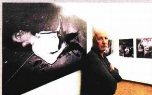
Syd Shelton sa svojim fotografijama

Prve večeri i manifestacije u galeriji Makina Syd Shelton otvorio je izložbu fotografija "A riot of our own", čiji naziv sam po sebi sugerira da ima veze s punkom. Ima, itekakve jer Shelton je bio tamo, na licu mjesta, kada se na londonskim ulicama krajem sedamdesetih stvarao jedan od najznačajnijih suvremenih glazbenih pravaca, ali i društvenih pokreta i to se vidi na njegovim fotografijama koje su neglamurozne, neuljepšane i istinite. One prikazuju samo punk energiju, već i pobune, suzavac na ulicama te turbne urbane vizure u kojima je punk iznikao i koje sugeriraju zašto se pojavio baš ovdje. Punk je povezao i izložbu sedmorice autora u staroj tiskari gdje su slike i instalacije izložili Eros Čakić, Ivan Dujmušić, Igor Ruf, Vjekoslava Sošić, Gildo Bavčević, Damir Čargonja Čarli i Jasmina Krajačić. Naime, upravo je ovaj zadnji dvojac u svojim slikama podsjetio na zlatno doba punka kroz Ramonese i The Clash.